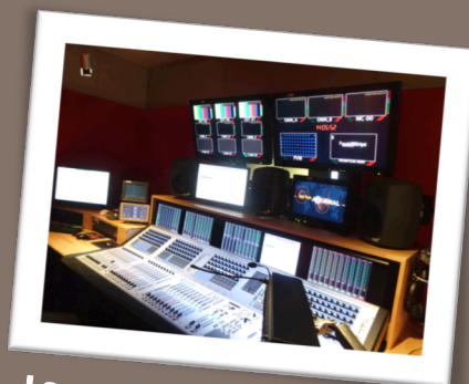
La salle de montage sonore

Après la remise des prix, les candidats ont eu le privilège de visiter les locaux de la chaîne franco-allemande. Ils ont ainsi pu découvrir l'envers du décor des nombreuses émissions diffusées par Arte. Ils ont également échangé avec des journalistes et des techniciens qui ont chaleureusement accepté de répondre à leurs nombreuses questions.