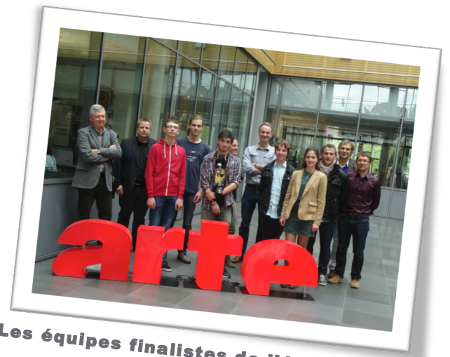
Les équipes finalistes de l'édition 2015

Quatre lycéens du LFVVG de La Haye ont gagné la finale de l'édition 2015 du concours Arte/CLEMI “Reportage” qui a eu lieu à Strasbourg ce 20 mai.