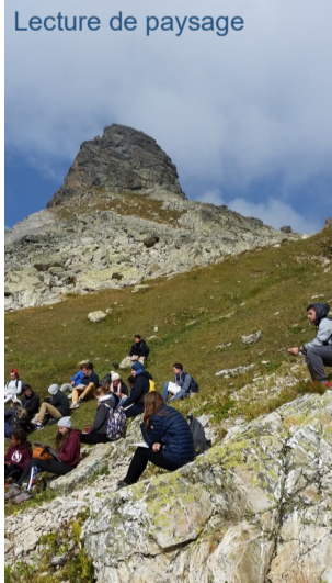
Lecture de paysage

Avec des températures beaucoup plus agréables cet après-midi, nous avons profité des activités d'eaux-vives et de la cité de Briançon (avec ses citadelles Vauban). »