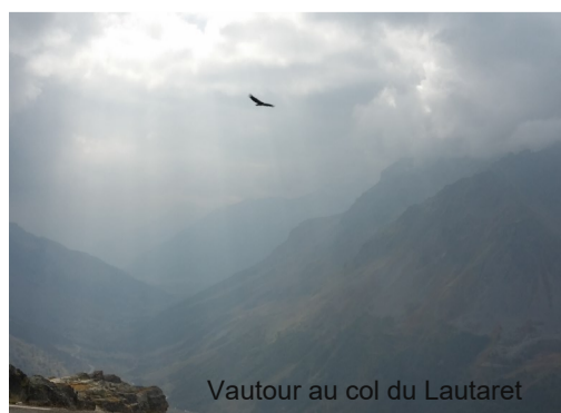
Vautour au col du Lautaret