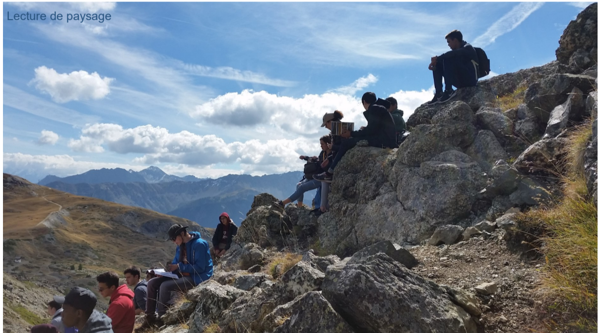
Lecture de paysage

« Aujourd'hui, l'ascension du Chenaillet avec un temps exceptionnel et un peu de fraîcheur ainsi que de la neige sur les sommets au loin. Grâce à l'étude des roches, on a pu constater que nous étions sur un océan du Jurassique supérieur ».