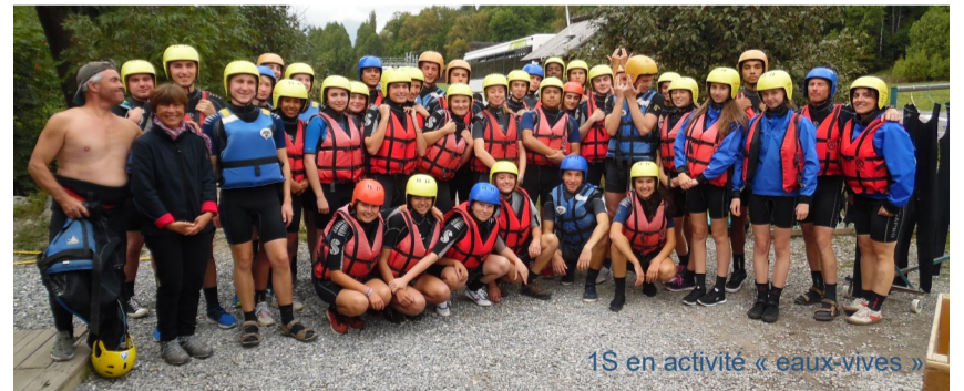
1S en activité « eaux-vives »