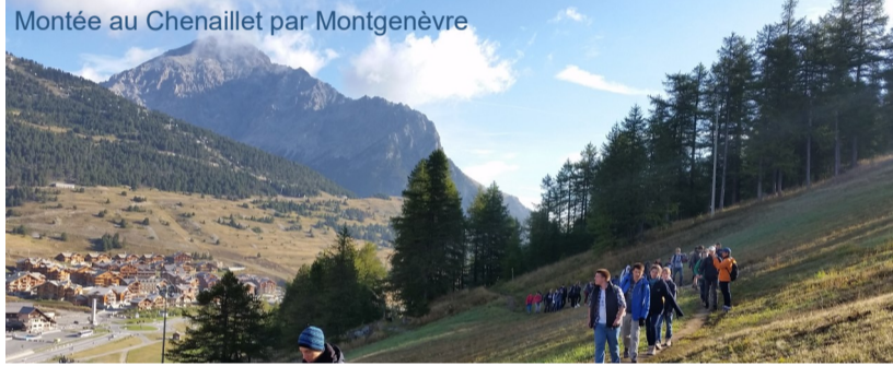
Vue depuis le Chenaillet