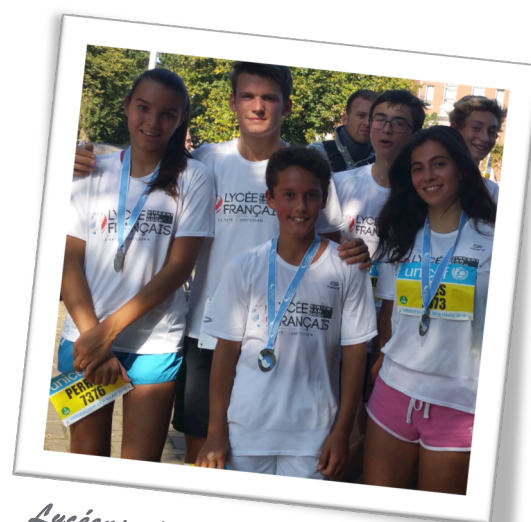
Lycéens et collégiens contents de leurs résultats

En ce samedi 24 septembre, toutes les conditions étaient réunies pour que nos brillants représentants portent haut et fort les couleurs du lycée. Des conditions climatiques idéales et une organisation